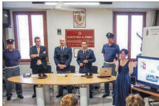
(conferenza stampa del 05 luglio 2014 per la presentazione del progetto SOS SORDI presso la Questura di Rimini)